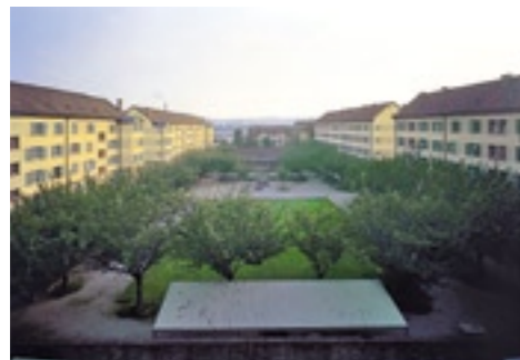
Der Erismannhof in Zürich ist so gross wie ein Fussballfeld.