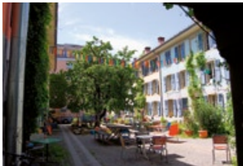
Der lauschige Innenhof am Dammweg in Bern wird von den Anwohnern rege genutzt.