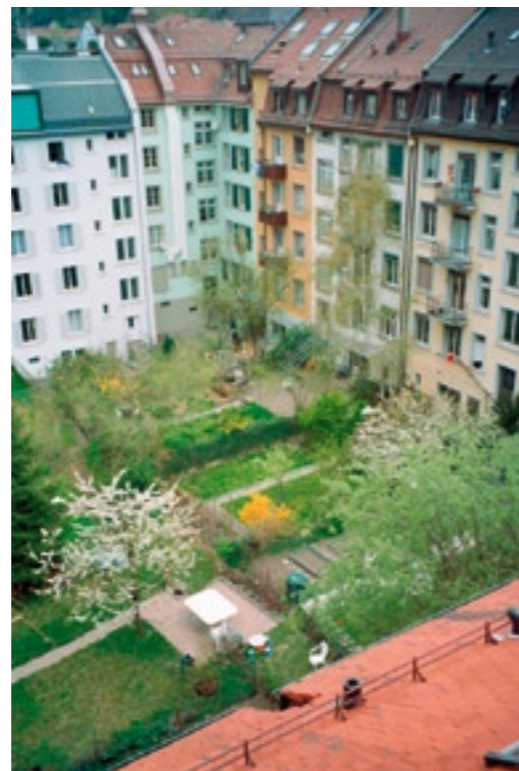
Die umliegenden Häuser haben einen direkten Zugang zu der grünen Oase in Zürich-Wipkingen.