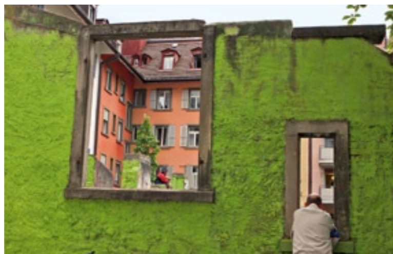
Bei der Sanierung des Klingenhofs in Zürich wurden Teile des Handwerksgebäudes stehen gelassen.

«Wo, wenn nicht in Höfen, können unbeaufsichtigte Kinder sicher spielen und Städter einen Rückzugsort im Freien finden?» Andreas Diethelm, Biologe