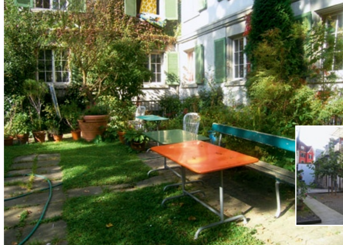
Links: Innenhof an der Zurlindenstrasse in Zürich. Unten: Im Hof des Dreiecks in Zürich wird gelebt, gefeiert und gespielt.

Eine Schere – Zwei Messer Accuschere mit Gras- und Strauchmesser