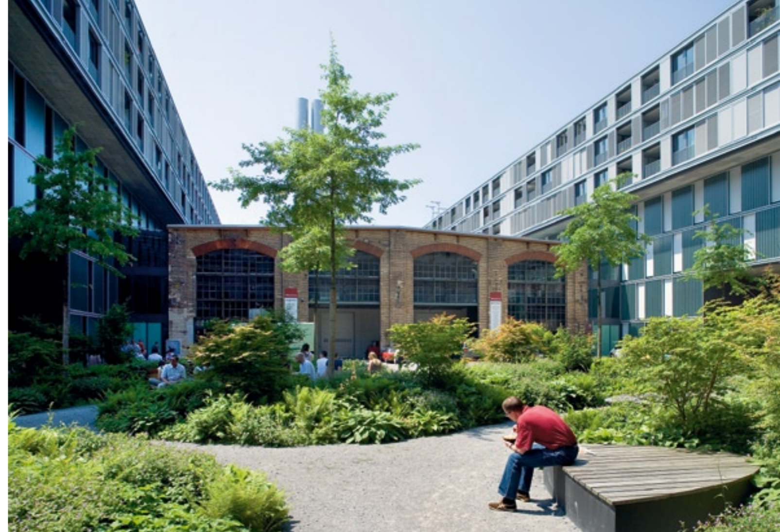
Schüler und Geschäftsleute schätzen in der Mittagspause die begrünte Anlage bei der Überbauung Puls 5 in Zürich.

Ein Hof älteren Musters ist der Erismannhof, vis-à-vis dem Güterbahnhof Zürich, erstellt 1928. Die Bauten folgen den Strassen und bilden so den Hofraum, einen fast fussballplatzgrossen Gemeinschaftsbereich. Portale führen in den Hof, lassen aber keine Autos zu. In den meisten städtischen und genossenschaftlichen Siedlungen ist das so geblieben. Anders ent-